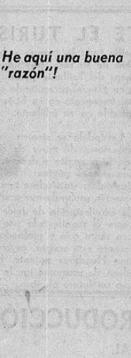
He aquí una buena "razón"!

Por esa misma razón es por la cual USTED debe asegurarse!