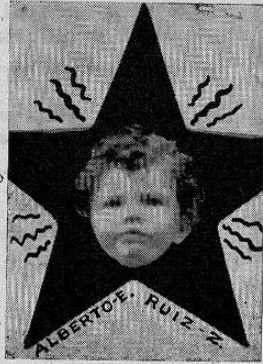
Todo el encanto de la inocencia, revela esta carita adorable, mundo de ternura y de ilusión que desfilan en la galería de nuestros amiguitos preferidos.