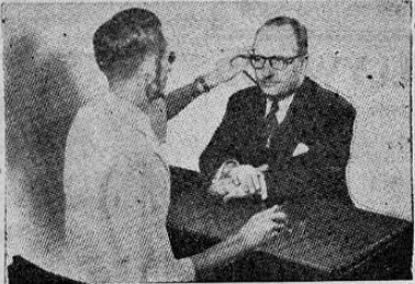
PREPARACION DE RECETAS DE OCULISTAS

Viene a nuestra página más a su florida existencia el próximo 5 de Setiembre en el cual sus numerosas amigas le rendirán homenaje de simpatía y admiración, a las que el periódico "Mundo Femenino" agrega las suyas muy cariñosas. Una primavera más a su florida existencia el próximo 5 de Setiembre en el cual sus numerosas amigas le rendirán homenaje de simpatía y admiración, a las que el periódico "Mundo Femenino" agrega las suyas muy cariñosas.