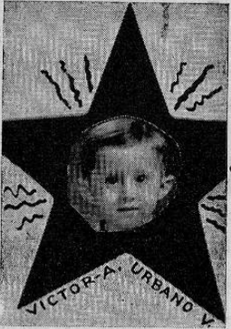
Su carita de cielo ilumina nuestra Página Infantil, poniendo en ella la nota angelical y la visión de luz. Es uno de nuestros queridos amiguitos.